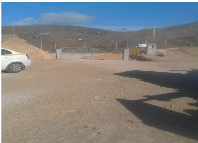
(β) Συμβολή του επαρχιακού δρόμου Βολισσού – Πираμάς με δρόμο προς ΣΜΑ