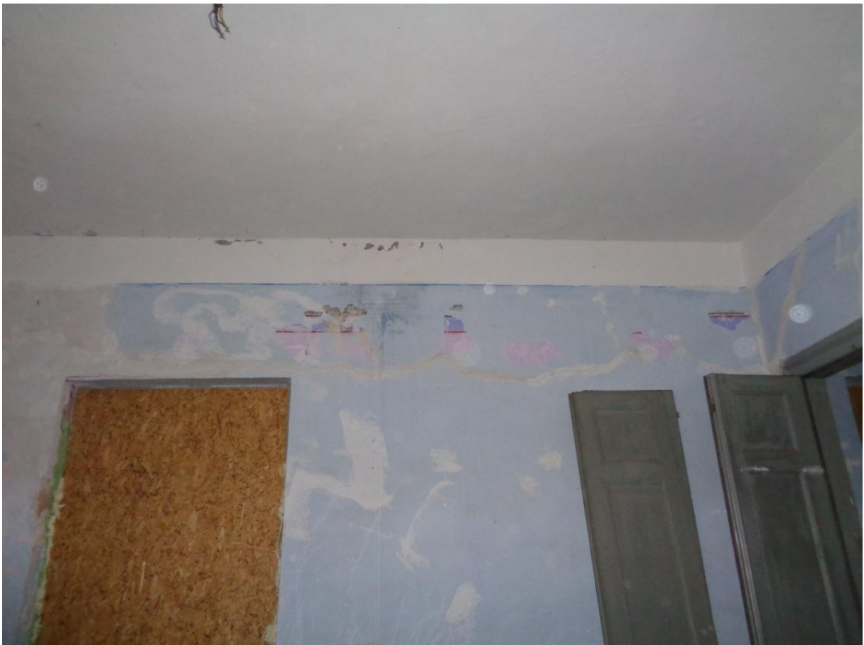
Φωτογραφία 5 Άποψη τοιχογραφίας στον όροφο του κτηρίου.