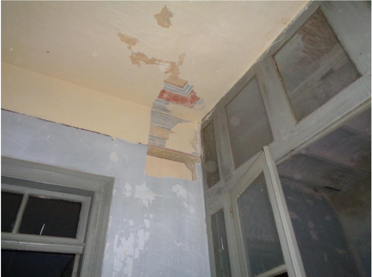
Φωτογραφία 4 Άποψη οροφograφίας και τοιχογραφίας στον όροφο του κτηρίου.