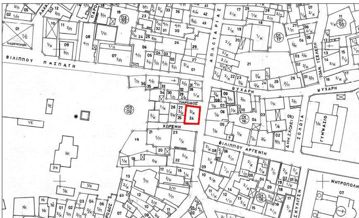
Εικόνα 1: Θέση κτηρίου σε απόσπασμα κτηματολογικού χάρτη

Προκειμένου να αποκατασταθεί η αισθητική και η λειτουργικότητα του κτηρίου, δεδομένου μάλιστα ότι αυτό έχει πρόσωπο στον πλέον εμπορικό δρόμο της πόλης της Χίου, ο Δήμος Χίου έχει ξεκινήσει τις διαδικασίες ωρίμανσης των απαιτούμενων μελετών αποκατάστασης και επανάχρησής του.