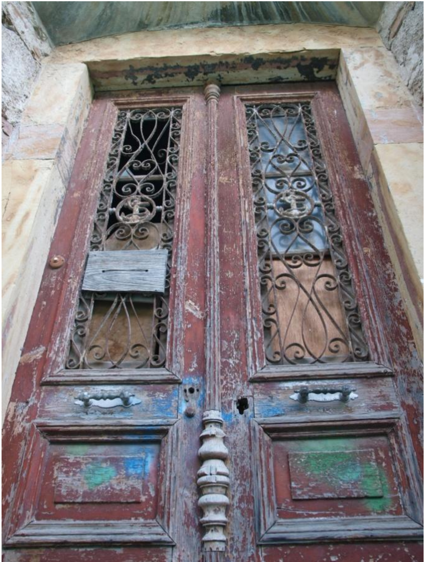
Φωτογραφία 13 Άποψη ξύλινης πόρτας εισόδου (από πεζόδρομο Χωρέμη).