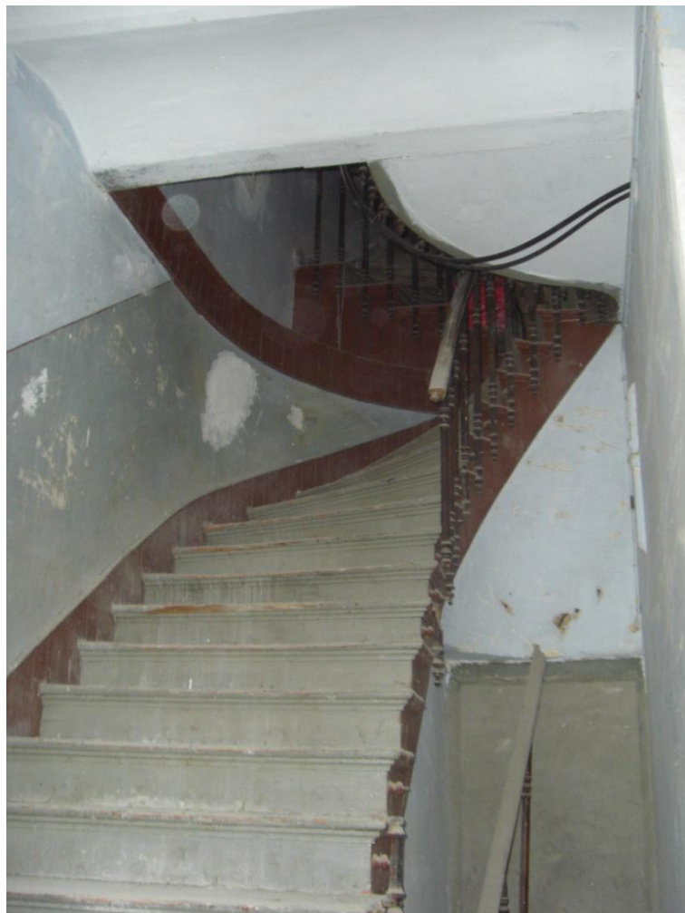
Φωτογραφία 10 Άποψη σκάλας από ισόγειο προς στον όροφο του κτηρίου.