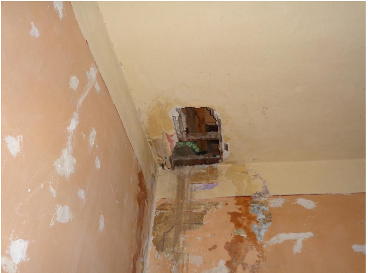
Φωτογραφία 8 Θέση εμφανούς παθογένειας στην οροφή του ορόφου. Διακρίνεται τμήμα της τοιχογραφίας.