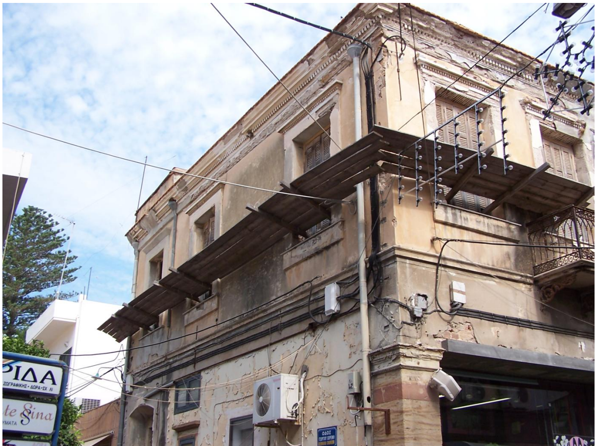
Φωτογραφία 3 Εξωτερική άποψη ορόφου κτηρίου από τη συμβολή με οδό Χωρέμη (πλαισιότερη φωτογραφία).