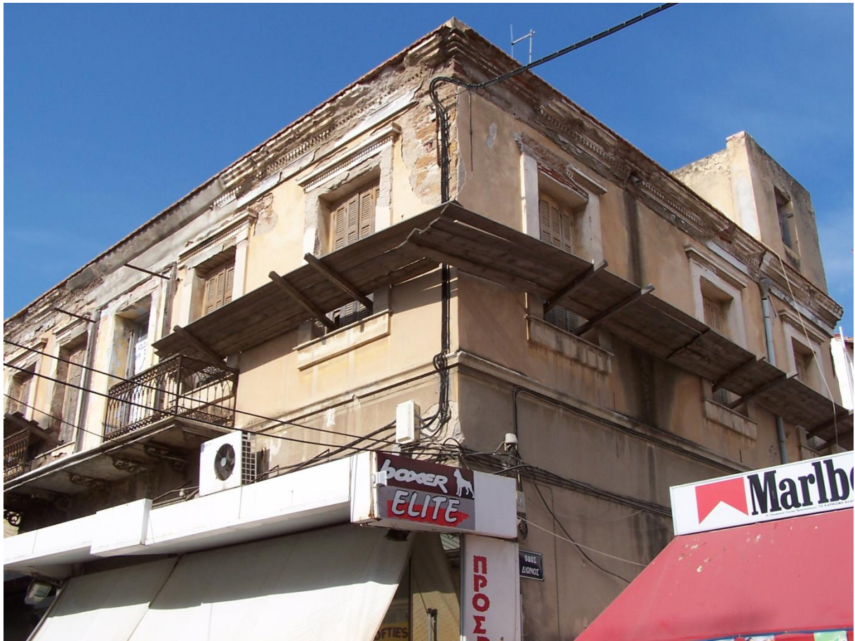
Φωτογραφία 2 Εξωτερική άποψη ορόφου κτηρίου από τη συμβολή με οδό Δίωνος (πλαισιότερη φωτογραφία).