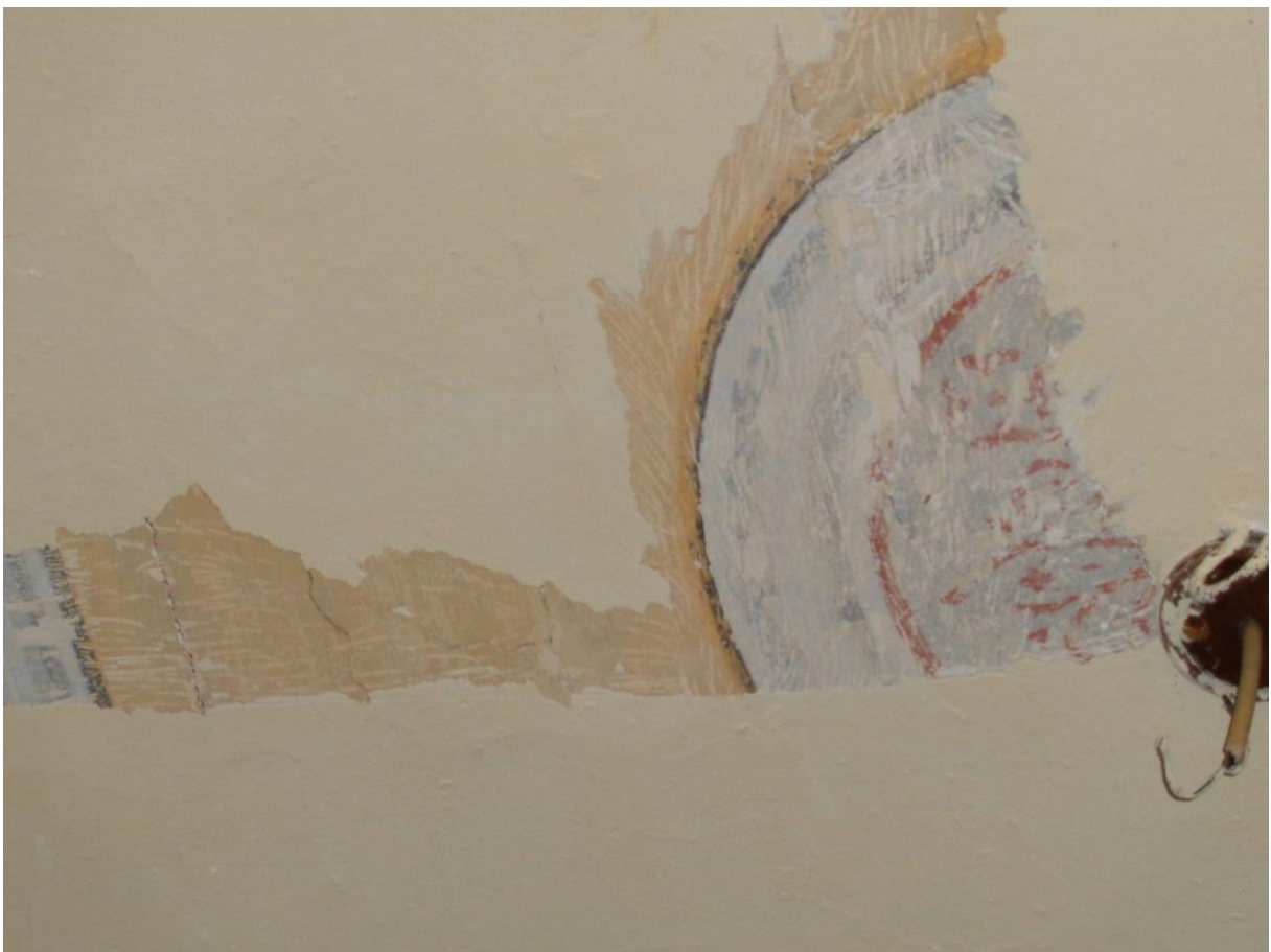
Φωτογραφία 7 Λεπτομέρεια οροφograφίας.