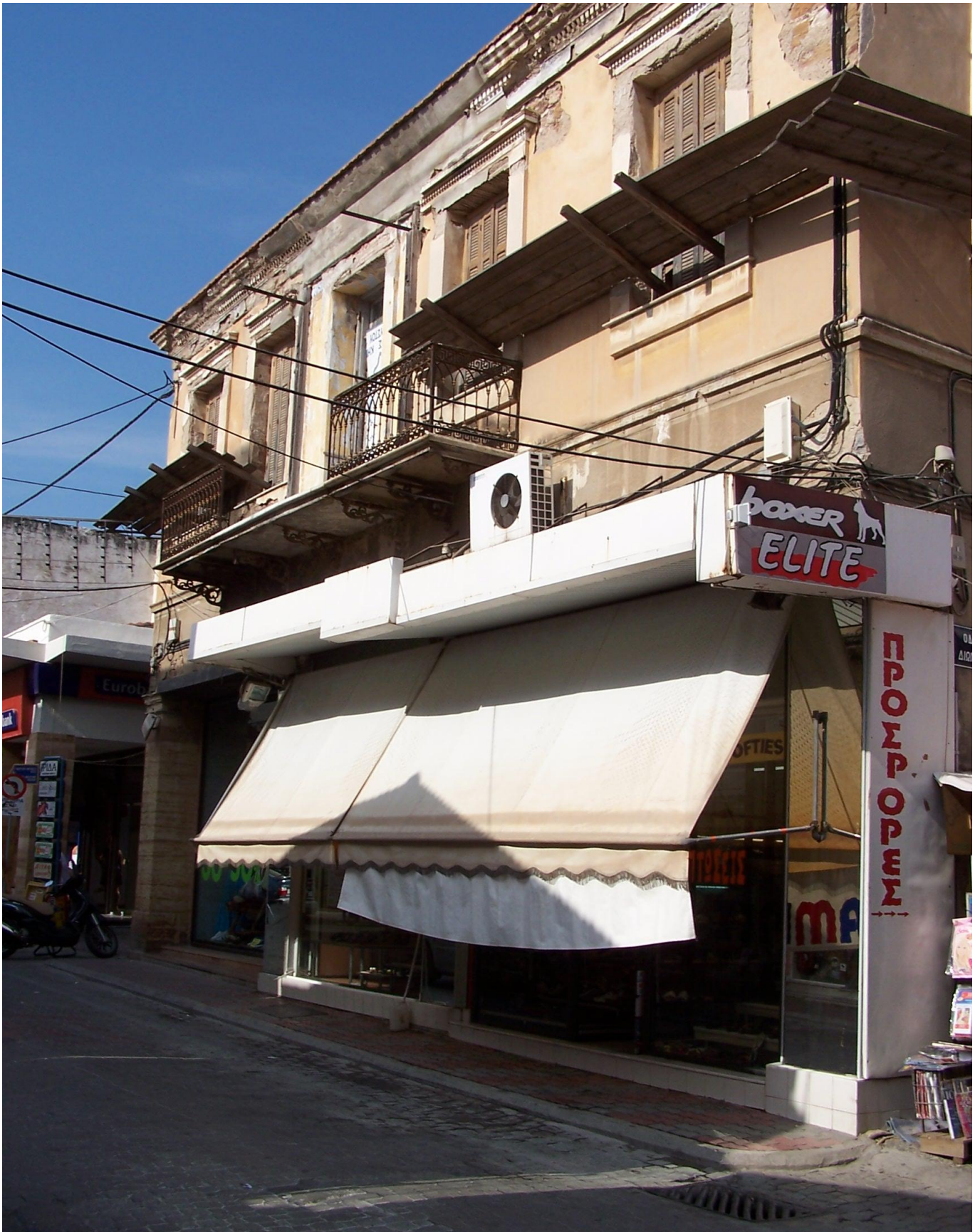
Φωτογραφία 1 Εξωτερική άποψη κτηρίου (παιλιότερη φωτογραφία).