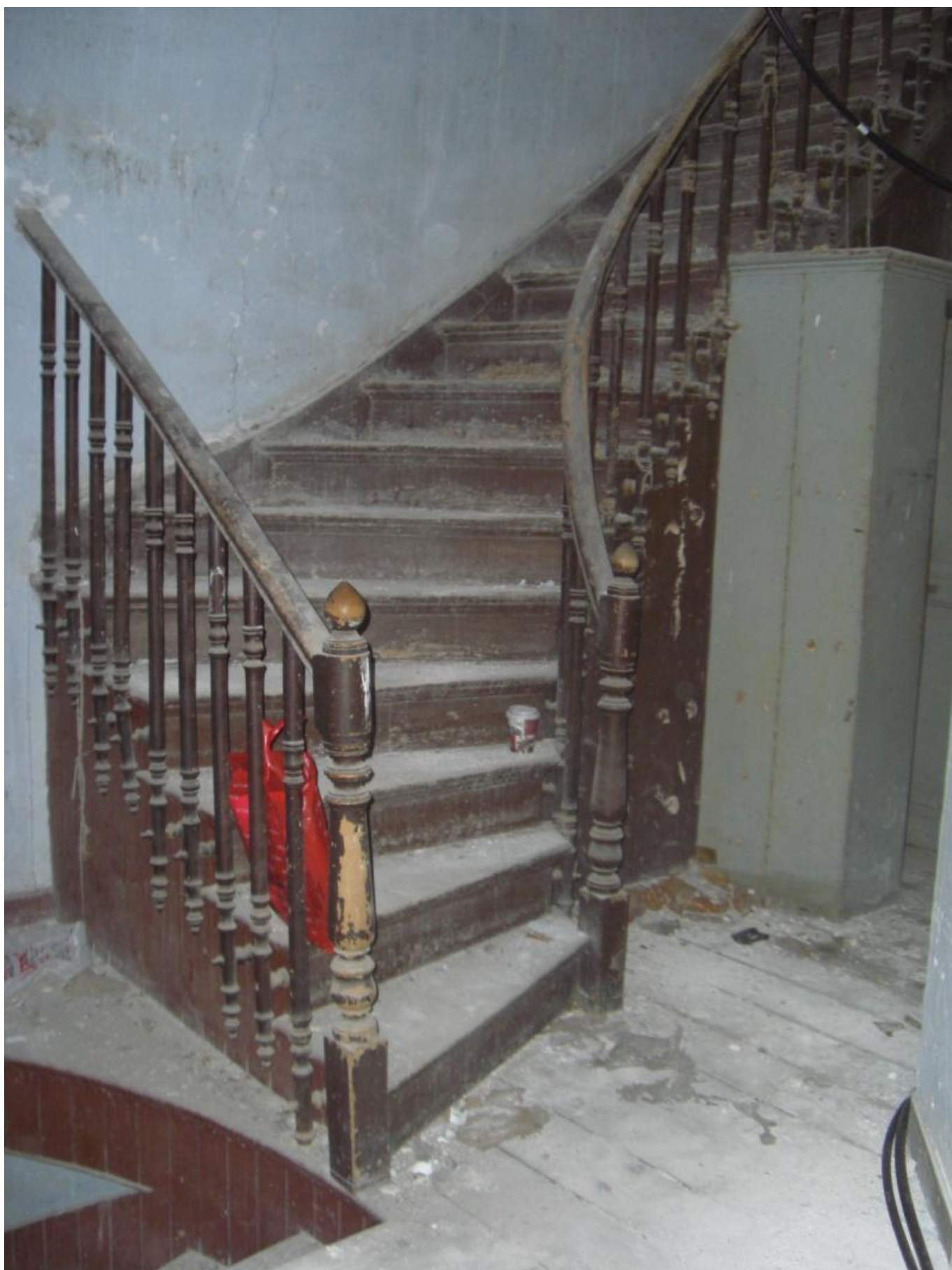
Φωτογραφία 12 Άποψη σκάλας από τον όροφο προς το δώμα του κτηρίου.