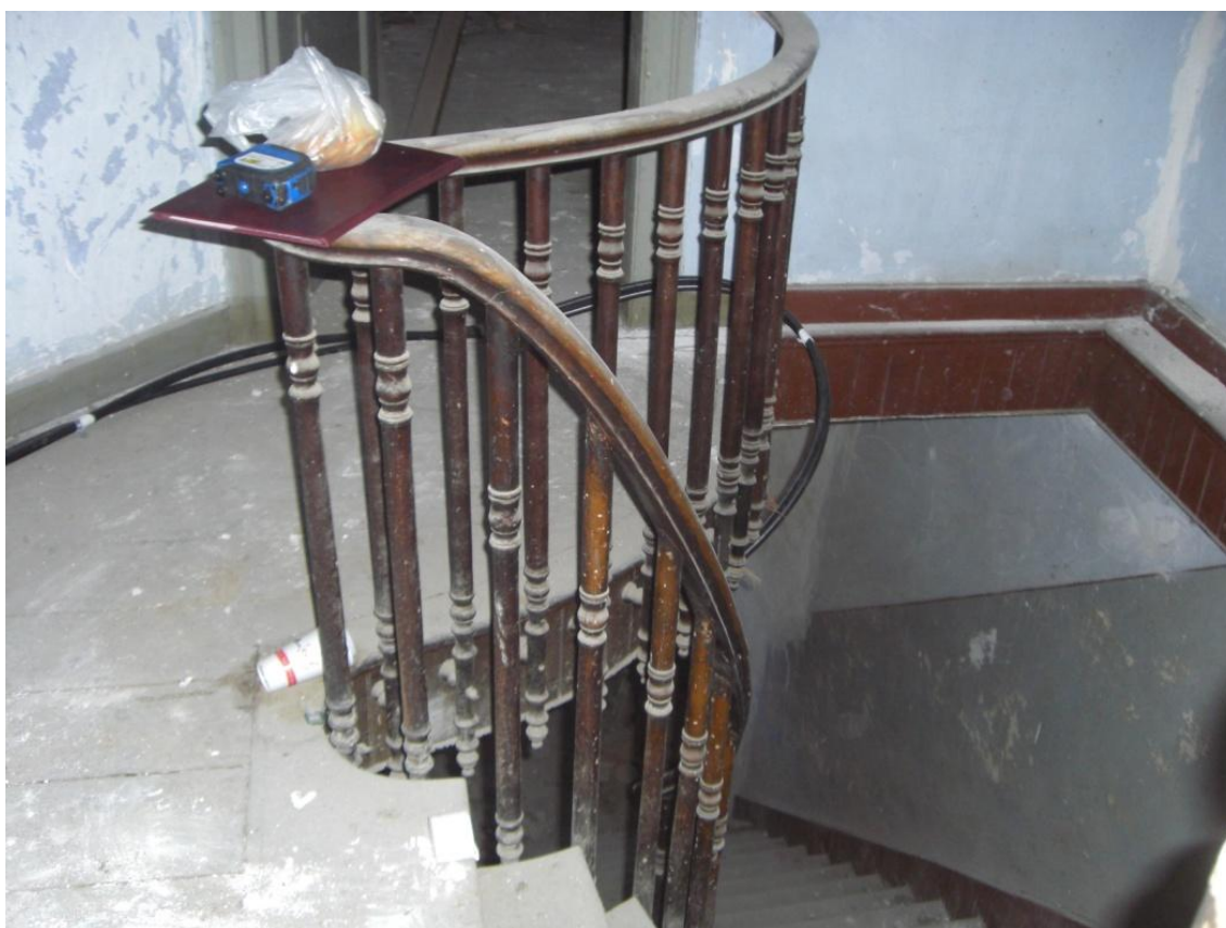
Φωτογραφία 11 Άποψη σκάλας από τον όροφο προς το ισόγειο του κτηρίου.