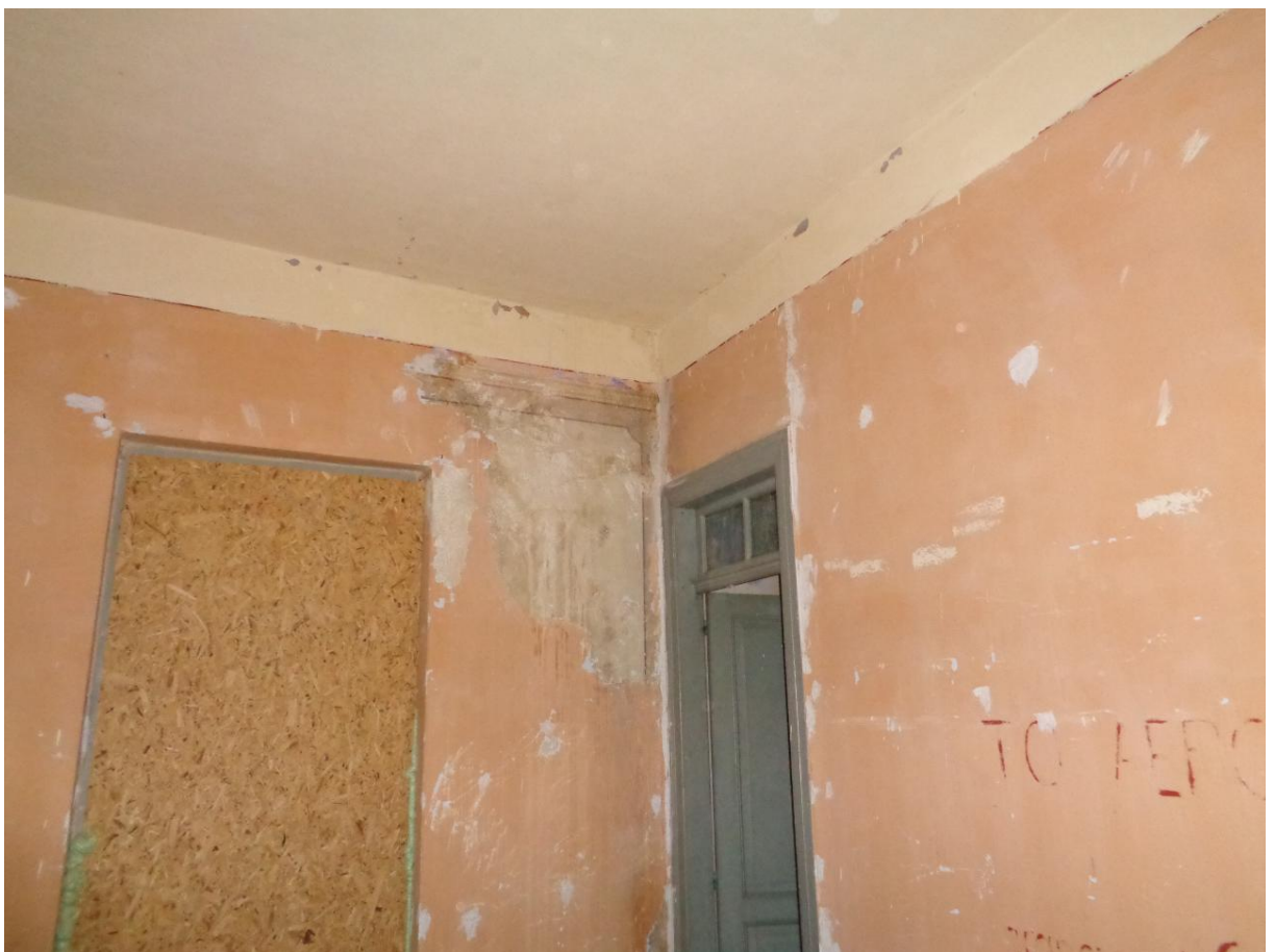
Φωτογραφία 9 Άποψη τοιχογραφίας στον όροφο του κτηρίου.