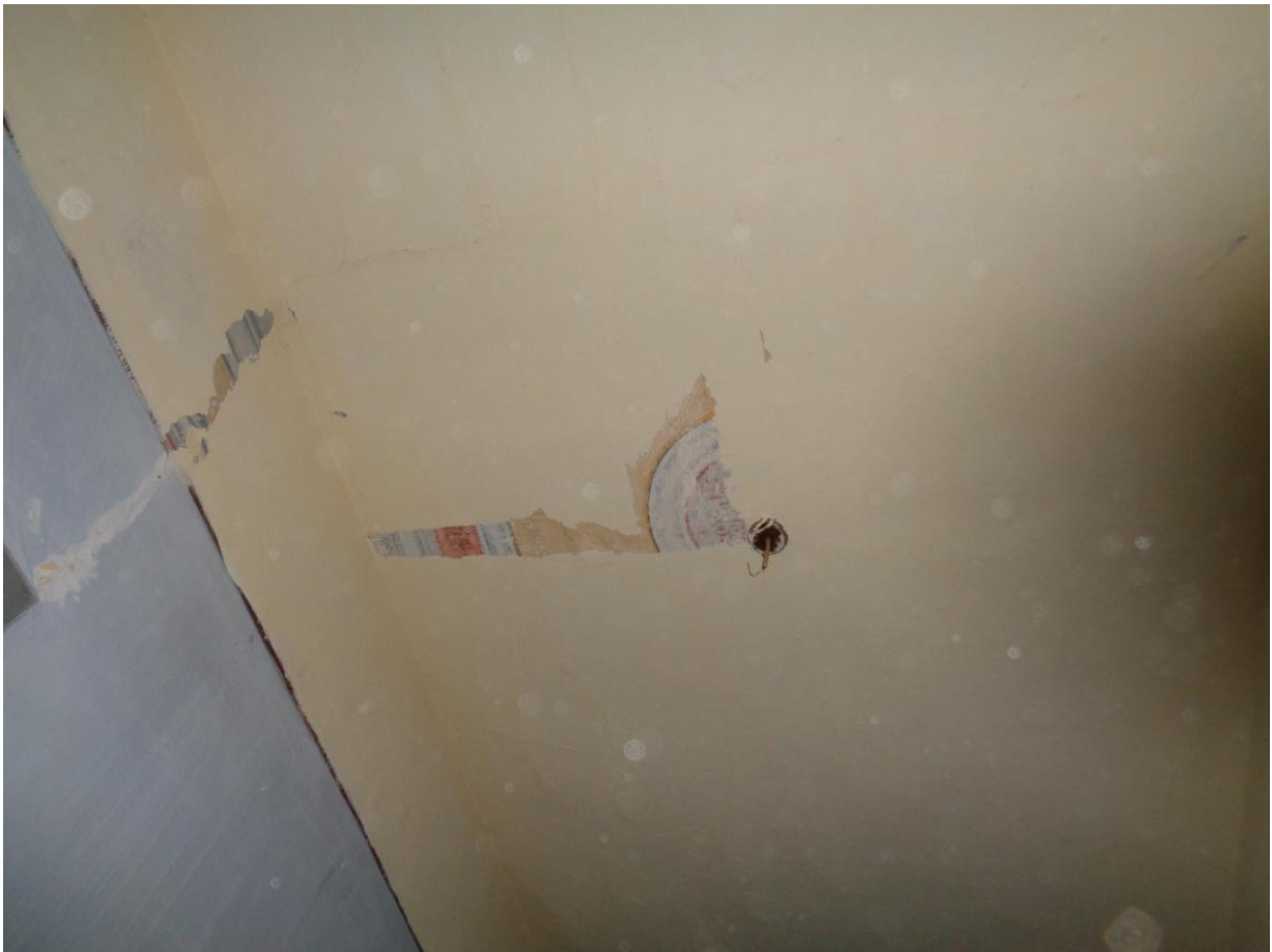
Φωτογραφία 6 Άποψη οροφograφίας και τοιχογραφίας στον όροφο του κτηρίου.