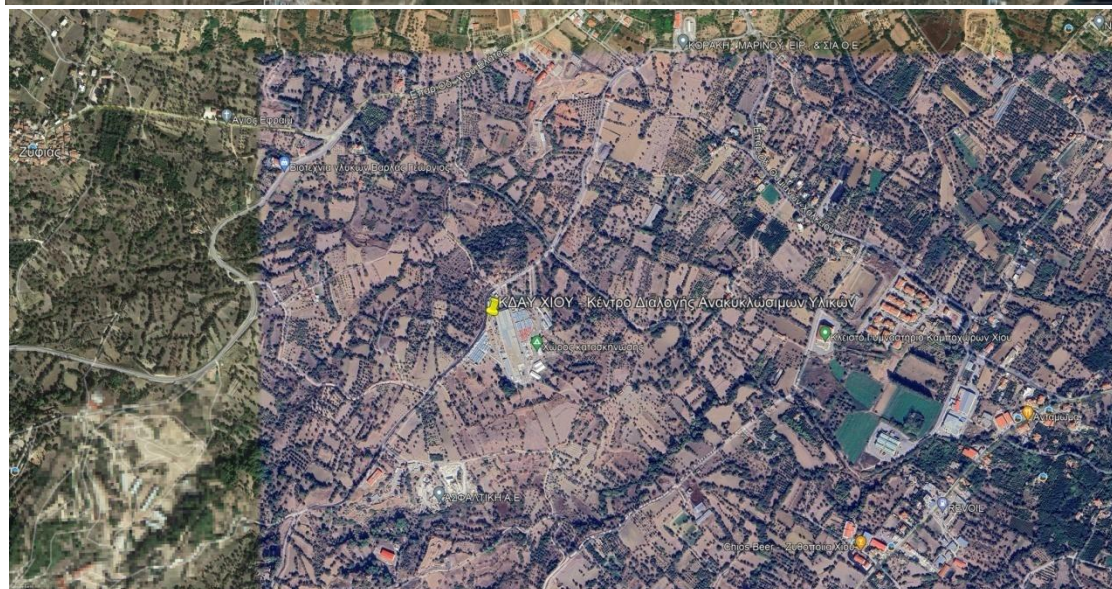
Απόσπασμα Χάρτη - GoogleMapsPro: Θέση: 1. Ποδαρα ΧΥΤΑ Χίου 2. Χαλκειός ΚΔΑΥ Χίου Κέντρο Διαλογής Ανακυκλώσιμων Υλικών