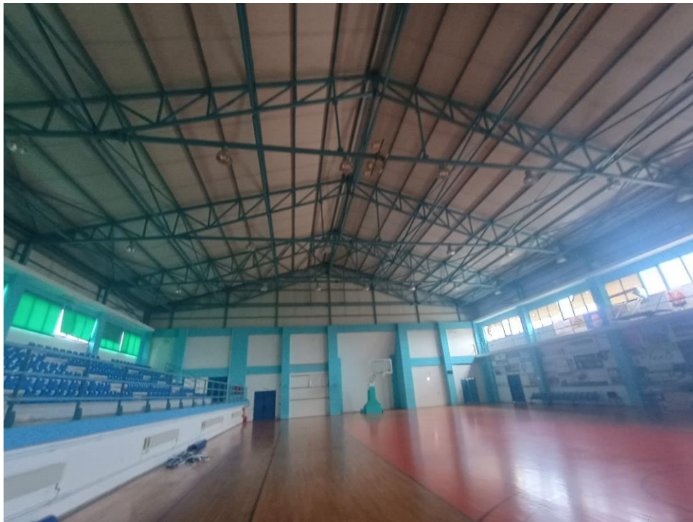
Εικόνα 2: Φωτιστικά Τύπου Καμπάνας Κλειστού Γηπέδου Καμποχώρων

Όλες οι εργασίες θα εκτελεσθούν σύμφωνα με το τιμολόγιο και τις υποδείξεις της Διευθύνουσας το έργο Υπηρεσίας. Ο προϋπολογισμός του έργου ανέρχεται στο ποσό των 240.000,00 € (μαζί με το Φ.Π.Α. 17%) και το έργο ανήκει στην κατηγορία «ΟΙΚΟΔΟΜΙΚΩΝ & ΗΜ» έργων. Τα μελετηθέντα τμήματα είναι αυτοτελή, αυτοπροστατευόμενα και ολοκληρώνονται.